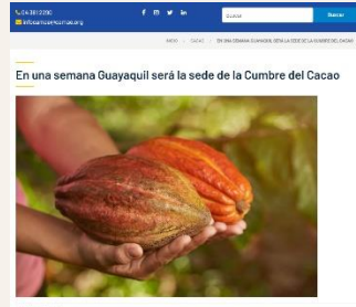
En una semana Guayaquil será la sede de la Cumbre del Cacao

negocios. El evento acogió también una feria de herramientas e implementos para la cosecha y producción del cacao y de otros productos agrícolas. Este acto se dio en un momento de gran relevancia para la industria, dado que, según la Organización Internacional del Cacao, Ecuador ocupa el tercer lugar mundial en producción de cacao. Las proyecciones para 2024 indican un crecimiento adicional del 10 % en comparación con el año anterior.